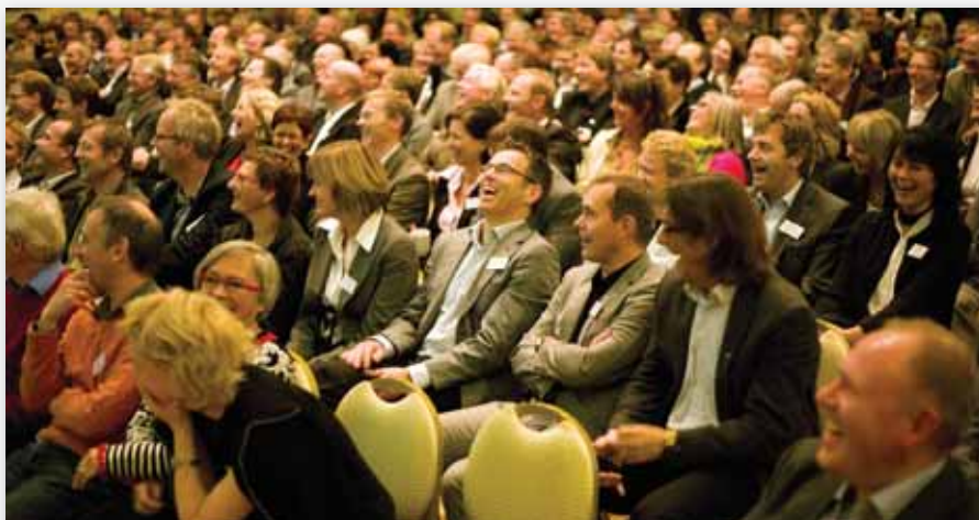
God stemning på Manifestasjon 08.